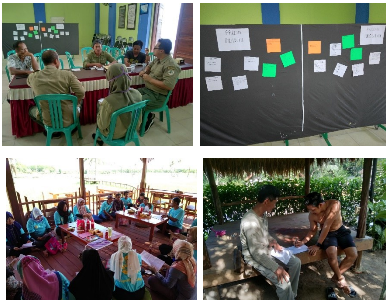
Gambar 2. Pertemuan Dan Diskusi Penyusunan Rencana Aksi

Pertemuan penyusunan Matriks Rencana Aksi, seperti tampak pada Gambar 2, Pemberdayaan Masyarakat Desa Karimunjawa disusun dengan memprioritaskan kegiatan yang belum dilaksanakan dalam RPM serta mempertimbangkan saran masukan dari hasil FGD. Matriks Rencana Aksi Pemberdayaan Masyarakat tersusun pada Tabel 1 berikut.