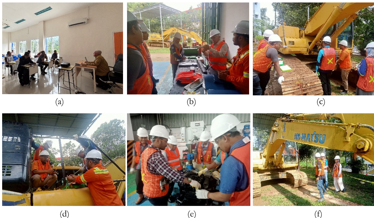
Gambar 3. Pelaksanaan pelatihan secara teori (a), pengenalan peralatan kerja dan bahan pendukung (b), praktek perawatan di unit (c) dan (d), praktek terhadap komponen yang sulit dijangkau di unit (e), dan menilai kualitas perawatan dengan mengoperasikan unit (f)

Kondisi dan situasi pelatihan berbasis kompetensi perawatan berkala alat berat small excavator seperti diperlihatkan dalam Gambar 3. Peserta mengikuti penyampaian materi pelatihan secara teori seperti dalam Gambar 3(a). Gambar 3(b) memperlihatkan pengenalan dan pemahaman peralatan kerja dan bahan pendukung kepada peserta sebelum melaksanakan praktek di unit. Pelatihan dilanjutkan dengan pelaksanaan praktek perawatan berkala di unit PC200-7 Komatsu, seperti ditunjukkan Gambar 3(c) dan 3(d). Selain itu, terdapat juga beberapa komponen yang sulit dijangkau dan dilihat langsung di unit. Kondisi ini dapat menyebabkan pemahaman dan kemampuan peserta yang tidak maksimal sehingga perlu menambahkan praktek di komponen yang terpisah dari unit seperti dalam Gambar 3(e). Gambar 3(f) memperlihatkan peserta menilai hasil perawatan berkala yang telah dilakukan dengan mengoperasikan unit PC200-7 Komatsu.