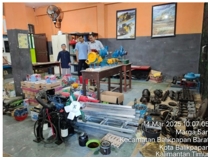
Gambar 1. Kondisi salah satu workshop alat berat di SMK

Terdapat beberapa SMK di Kota Balikpapan dan sekitarnya yang menyelenggarakan Prodi Alat Berat. Kendala yang terjadi adalah masih minimnya peralatan praktek dan peralatan praktek yang dimiliki berupa alat peraga atau per bagian komponen seperti diperlihatkan dalam Gambar 1. Tanpa fasilitas praktek yang memadai dan sulitnya untuk mengikuti magang industri atau benchmarking teknologi terkini, menyebabkan kemampuan inovatif dan adaptasi guru terhadap perkembangan teknologi menjadi lambat (25). Meningkatkan dan terpeliharanya kompetensi guru sangat penting, karena kompetensi guru memiliki dampak terhadap prestasi belajar siswa SMK (26).